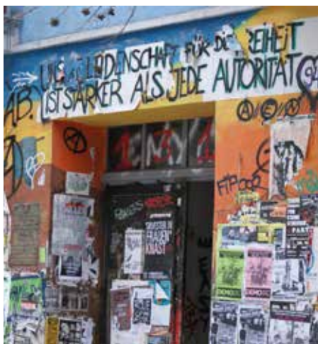
Hauseingang in der Rigaer Straße

„Die Lehre, die Extremisten daraus ziehen, ist, für ihre Krawalle, Brandanschläge und Angriffe auf Polizisten mit einem Haus belohnt zu werden“, kritisierte der CDU-Generalsekretär Kai Wegner scharf. „Damit will sich die SPD Ruhe und Ordnung ergaunern. Das ist eine Bankrotterklärung des Rechtsstaates.“ Die CDU bleibt bei ihrer klaren Linie. „Es darf kein Steuergeld in linksautonome Strukturen fließen. Das Geld benötigen wir für mehr Polizei, für den Bau neuer Wohnungen und für die Schulen“, so Wegner.