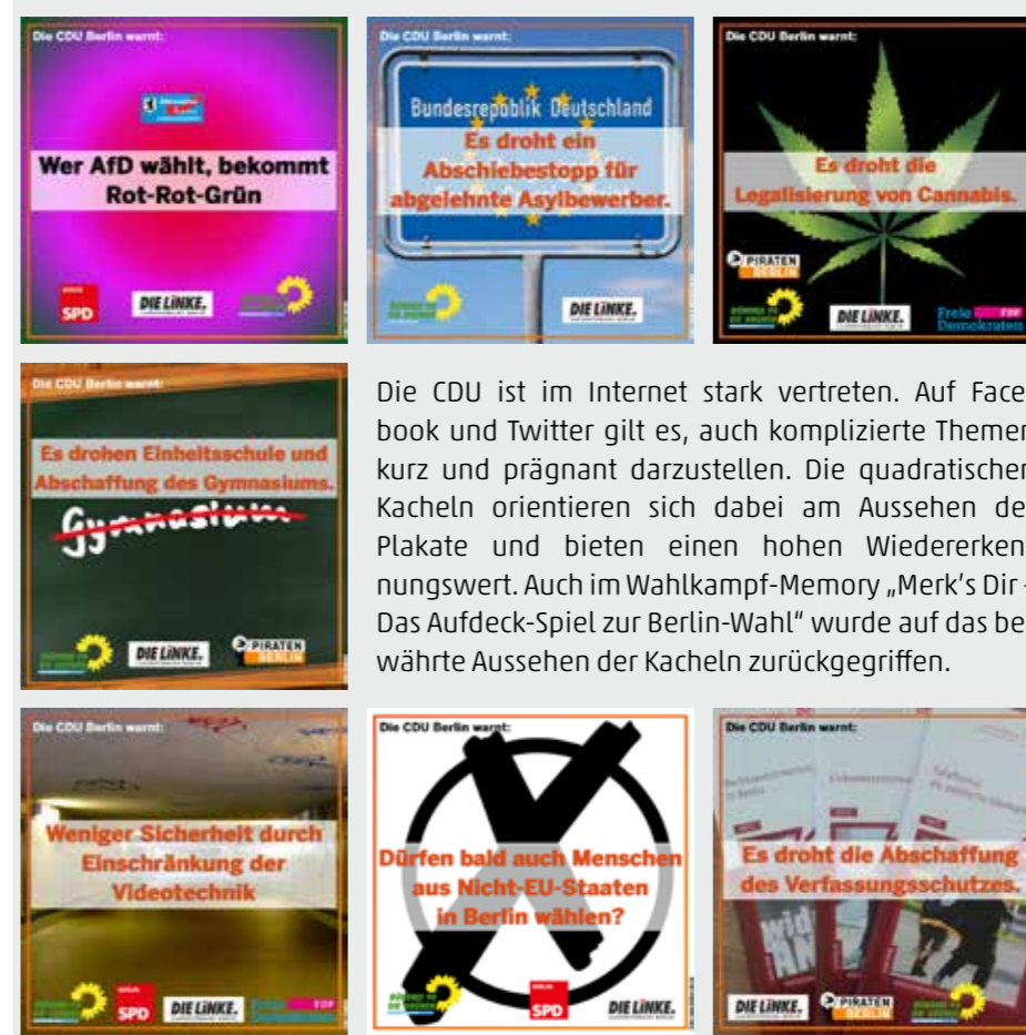
V.i.S.d.P.: CDU Landesverband Berlin, Landesgeschäftsführer Dirk Reitze, Kleiststraße 23-26, 10787 Berlin; Redaktion: Reitze, Pietsch, Schmelter, von Diest; Satz/Bild: Liefänder; Fotos: Gero Breloer, Dirk Reitze

keit. In der politischen Mitte müssten die Parteien jedoch koalitionsfähig bleiben. Schließlich sei das Maß der Dinge, was das Beste für Berlin ist, und nicht für die eigene Befindlichkeit. „Gerade in Zeiten der Ungewissheit braucht unsere Stadt stabile Verhältnisse. Ich kämpfe daher für eine starke CDU und ein starkes Berlin“, bekräftigt CDU-Spitzenkandidat Frank Henkel.