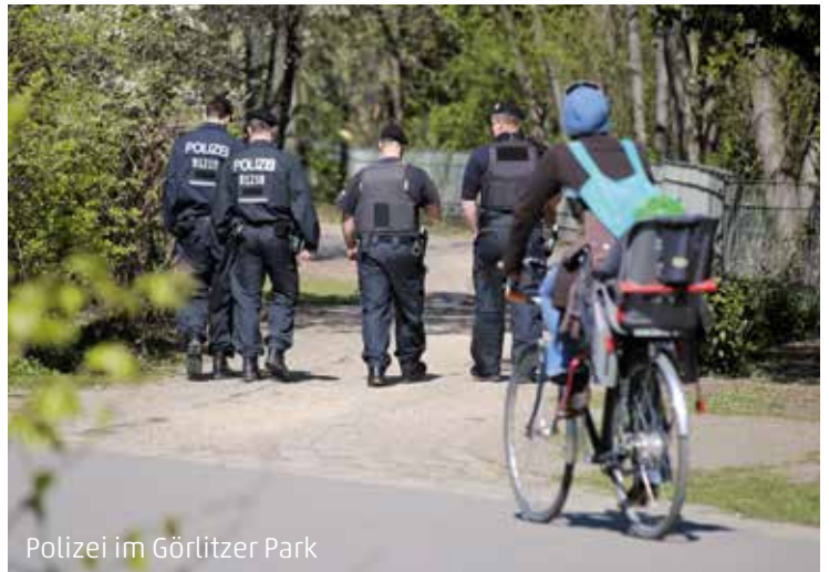
Polizei im Görlitzer Park

In der Diskussion um das von Linksautonomen besetzte Haus in der Rigaer Straße 94 hat der SPD-Finanzsenator die landeseigene Wohnungsbaugesellschaft Degewo beauftragt, Verhandlungen mit