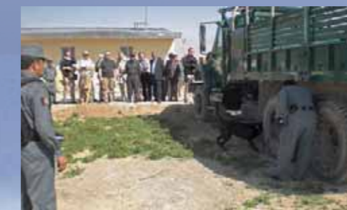
Eine von den Deutschen ausgebildete Hundestafel bei einer Übung

Der letzte Tag begann mit dem Besuch der Delegation des gerade mit deutschen Mitteln fertig gestellten International Airport Mazar-e Sharif, welcher 2014 in Betrieb gehen soll. Eigens für die Einhaltung der Grenzüberwachung und Zollaufgaben wurde in Afghanistan eine Hundestafel geschaffen und vom GPPT ausgebildet. Bei einer praktischen Vorführung der Einsatzmittel zeigen die Afghanen die kontinuierliche Weiterentwicklung ihrer Fähigkeiten. Die außerordentliche Entwicklungs- und Aufbauhilfe Deutschlands ist ein wichtiger Einsatz um den Gefahren des Terrorismus Einhalt zu gewähren. Ein Menschenleben hatte in Afghanistan jahrzehntelang wenig Wert. Die Arbeit der ISAF-Mission unter deutscher Beteiligung