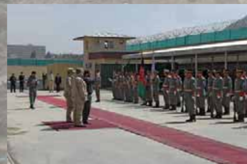
Ein gut geschützter Appell zu Ehren der Gäste aus Deutschland

Aus der eigentlich als Umsteige-Stopp auf der Weiterreise nach Mazar-e Sharif geplanten Landung in Kabul, wurde aufgrund der schlechten Wetterlage ein mehrstündiger Aufenthalt. Die Zeit wird zur kurzen, ersten Vorstellung der Missionen genutzt, allen voran der seit 2002 laufenden polizeilichen Projektgruppe des German Police Project Team (GPPT). Rund 200 deutsche Polizisten haben in den letzten zehn Jahren afghanische Polizisten und Polizei-Ausbilder – so genannte Trainees – ausgebildet. Durch die Deutsche Hilfe konnte in dem immer noch sicherheitspolitisch instabilen Land eine eigene Polizeistruktur aufgebaut und zudem ein funktionierendes Ausbildungssystem geschaffen werden. Ein Land mit 29,8 Mio. Einwohnern, die sich auf einer Gesamtfläche von über 650.000 km 2 aus mindestens vier ethnischen und drei religiösen Gruppierungen zusammensetzen, hat jedoch völlig andere, unbekannte Sicherheitsanforderungen. Das afghanische Volk hat jahrzehntelange Kriege hinter sich; es ist arm: arm an Bildung, arm an Infrastruktur, arm an Kultur