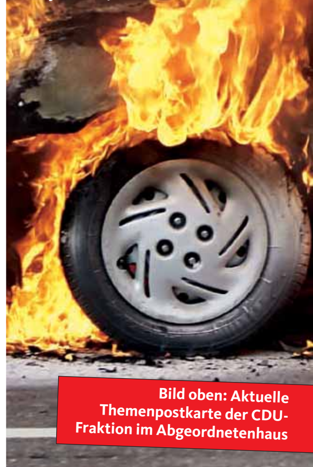
Bild oben: Aktuelle Themenpostkarte der CDU-Fraktion im Abgeordnetenhaus

„Für die meisten ist das eine Phase, damit sie später, wenn sie Ärzte oder Rechtsanwälte sind, ihren Kindern sagen können, sie haben auch mal einen Stein geworfen...“ (Ehrhart Körting, Berliner Morgenpost, 09. Juni 2008)